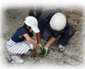
※てっきんけっそく体験