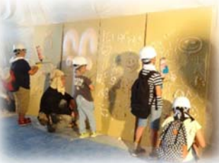
※ウレタンふきつけ体験